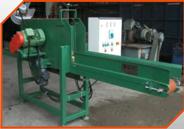
Talaş Alma Makinaları Chip-Making Machine