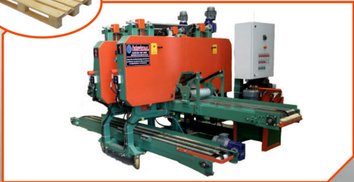
ÇYD - 102 Geniş Konveyörlü Makine / Wide Conveyor Machine