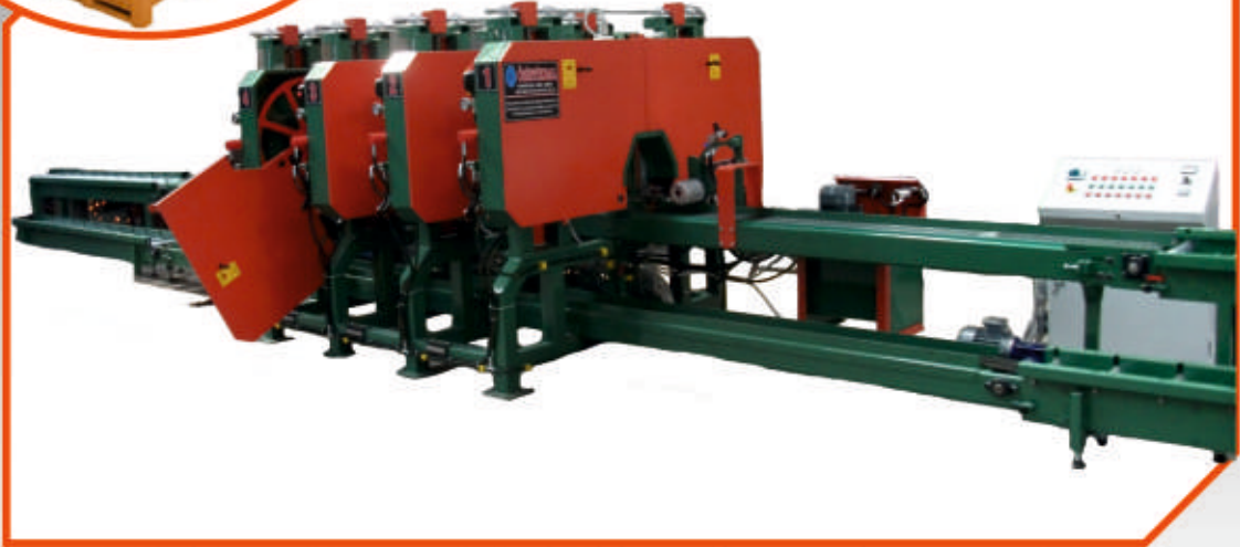
ÇYD - 104 Uzun Konveyörlü Makine / Long Conveyor Machine