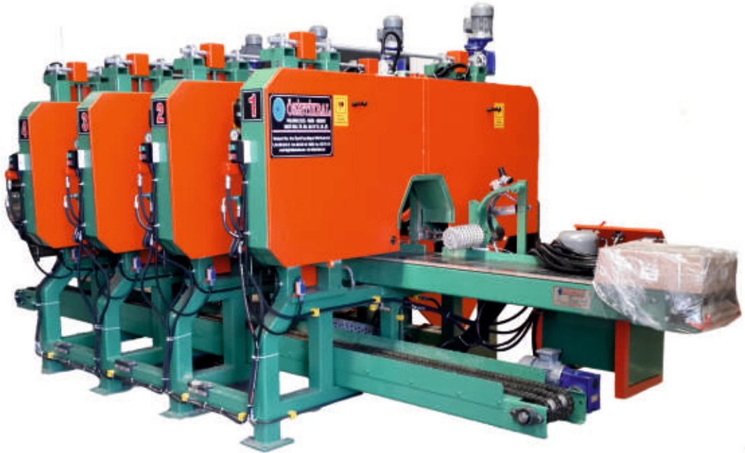
ÇYD - 104 Standart Makine / Standard Machine