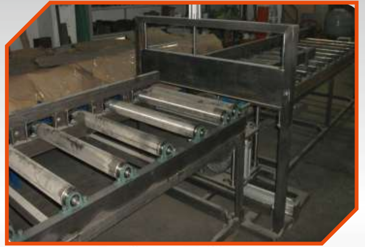
Boylama Makinası Sorting Machine