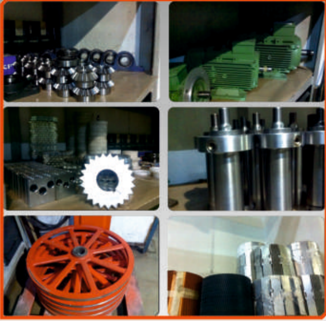
Makina Yedek Parçaları Machine Spare Parts