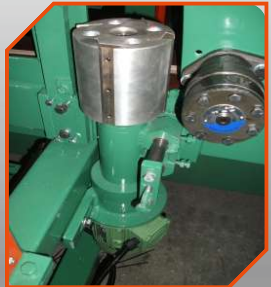
Sakal Alma Facial-Making Machine